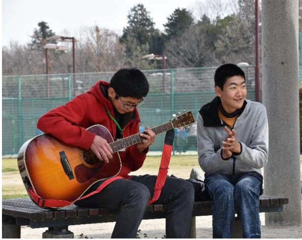
お兄さんチームはギターの練習