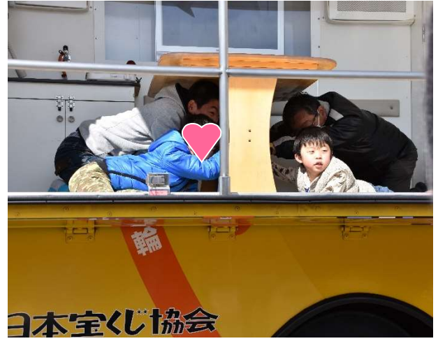
なまず号で地震を体験！机の下に避難！